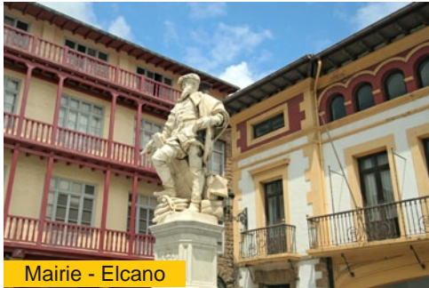
Mairie - Elcano