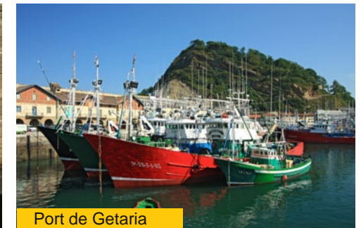
Port de Getaria